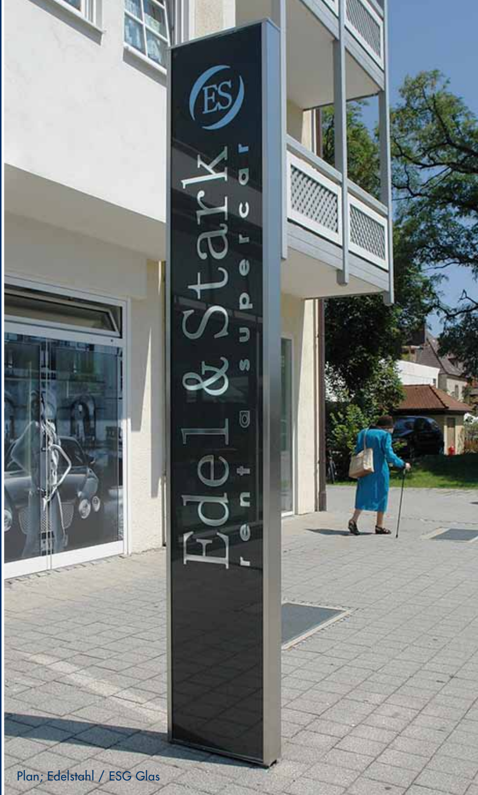
Plan; Edelstahl / ESG Glas