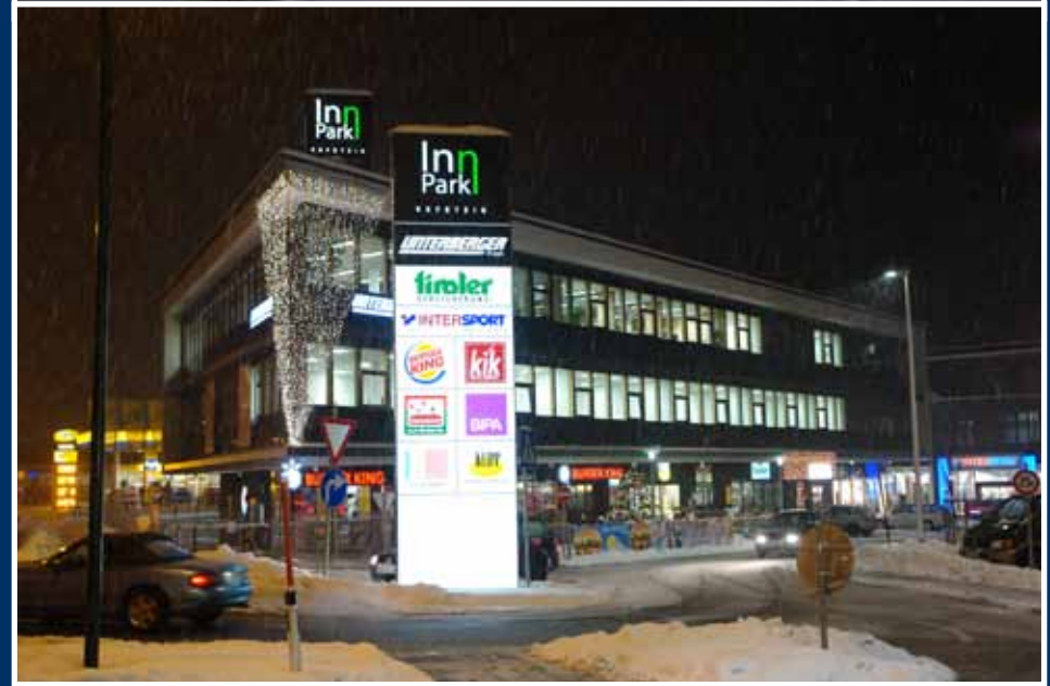
Plan; Aluminium / Spannfolie