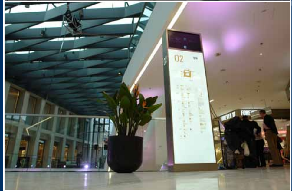
oben: Plan; Edelstahl / ESG Glas unten: Plan, Edelstahl / Acrylglas