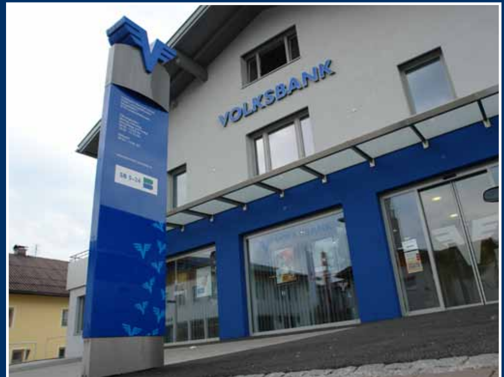
Sonderform; Aluminium / Acrylglas

Pylone sind sowohl im Innen- als auch im Außenbereich einsetzbar und in den verschiedensten Ausführungen, Materialien und Techniken erhältlich.