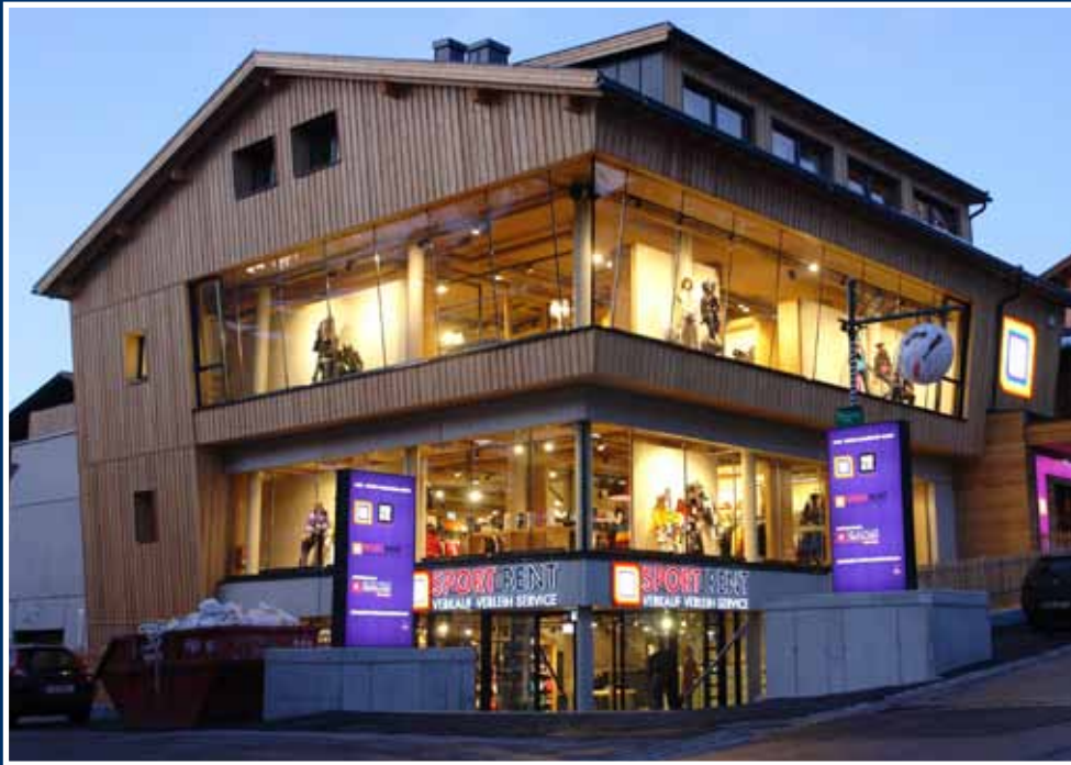
Plan; Aluminium / Spannfolie

Unterstreichen Sie die Wertigkeit Ihres Firmengebäudes mit einem neuen Outfit.