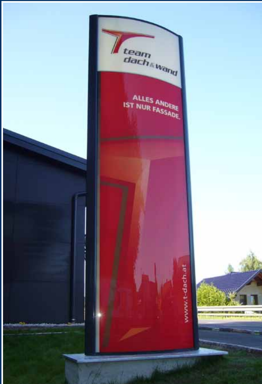
Ellipso; Aluminium / Acrylglas

Sie suchen ein auffallendes Leitsystem und/oder eine Standortkennzeichnung?