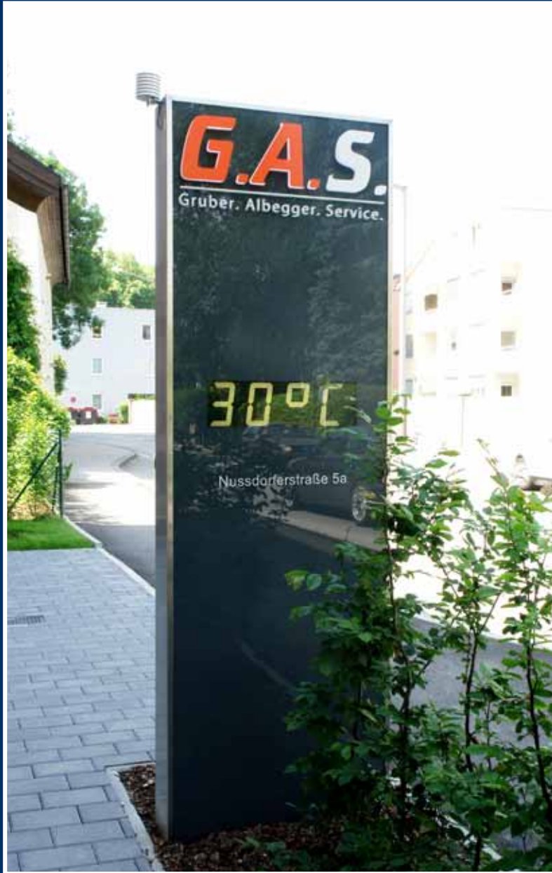
Plan; Edelstahl / ESG Glas; Vollacrylbuchstaben; LED Anzeige;