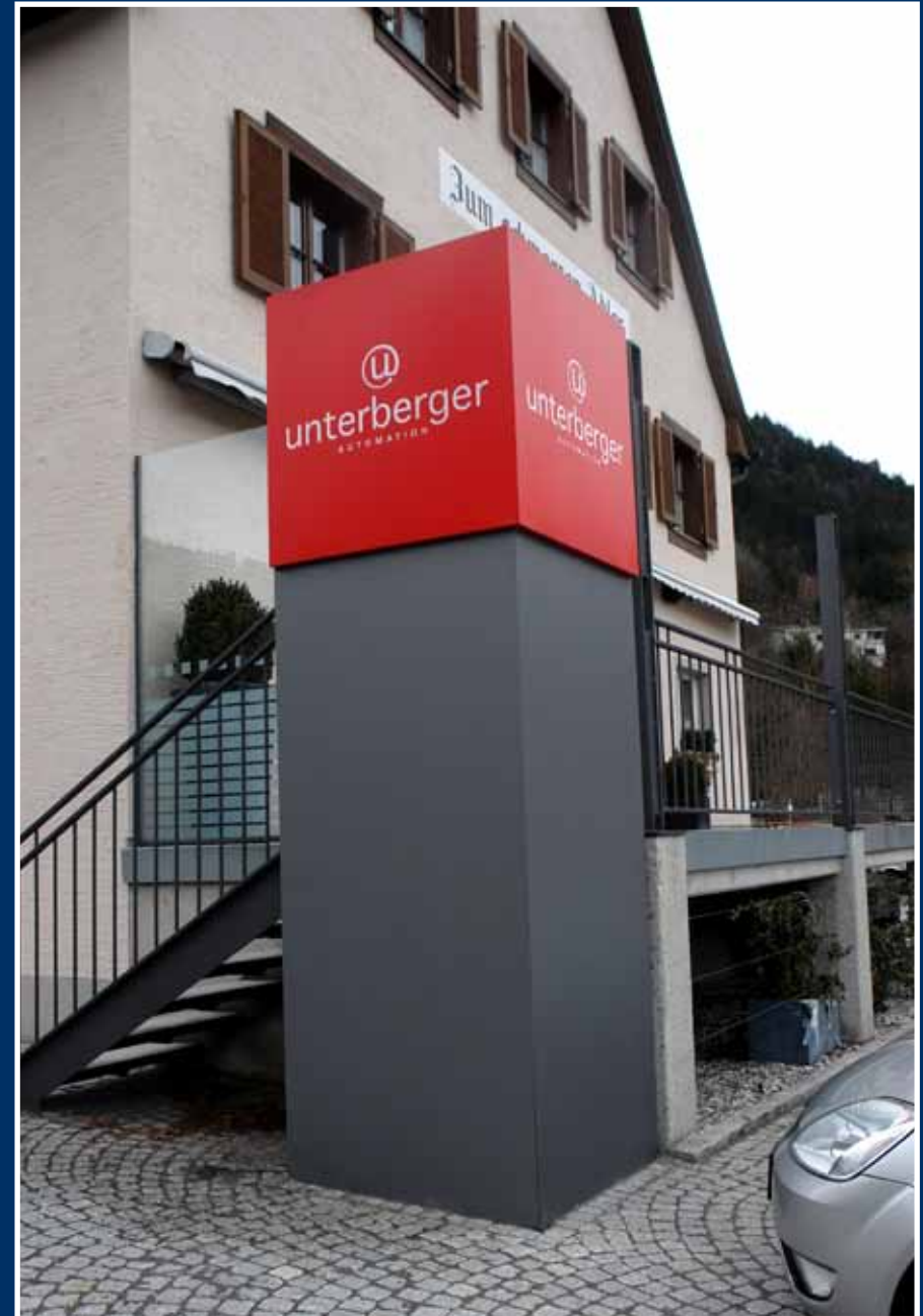
Plan; Aluminium / Acrylglas