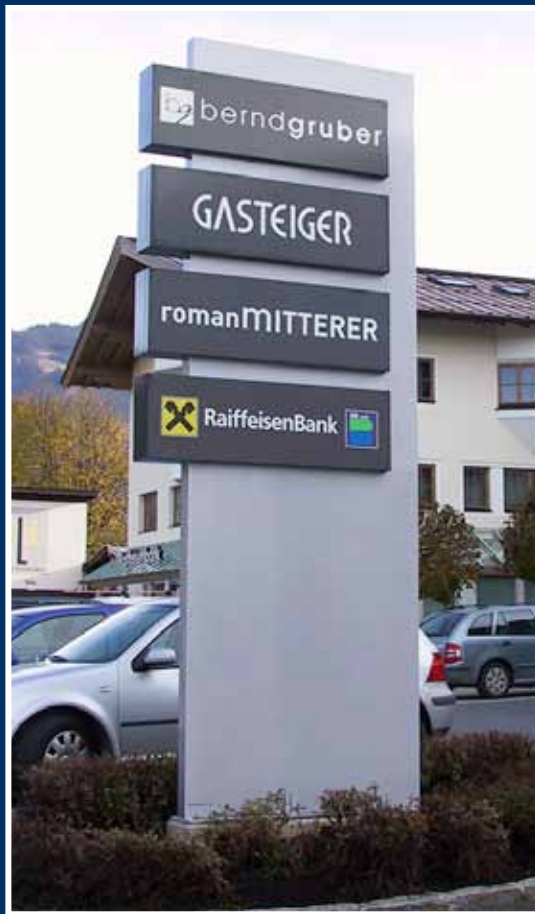
Sonderformen; Aluminium / Acrylglas

Ob Sie ein klassisches Erscheinungsbild mit klaren geometrischen Formen, oder eine komplexere Bauweise wünschen - hochwertige Materialien kommen in jedem Fall zum Einsatz. Die Möglichkeiten sind grenzenlos.