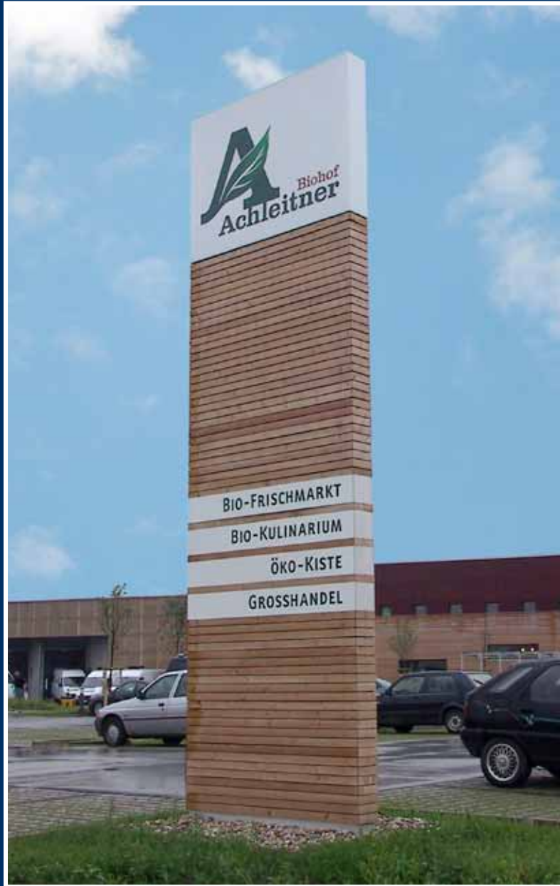
Plan; Aluminium / Holz Sonderanfertigung