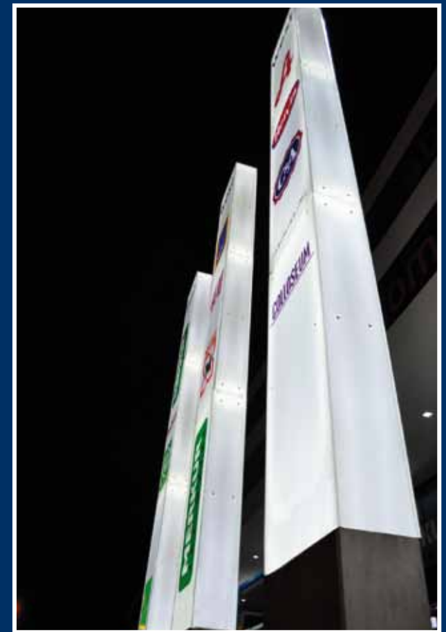
Plan; ESG Glas