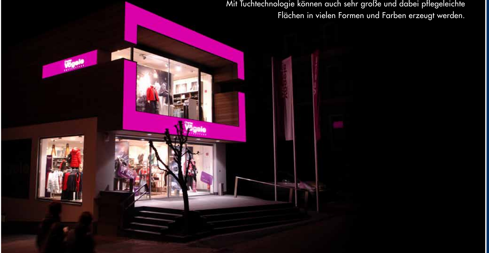
Spannfolienleuchtkästen; auffällige Sonderausführung

Mit Tuchtechnologie können auch sehr große und dabei pflegeleichte Flächen in vielen Formen und Farben erzeugt werden.