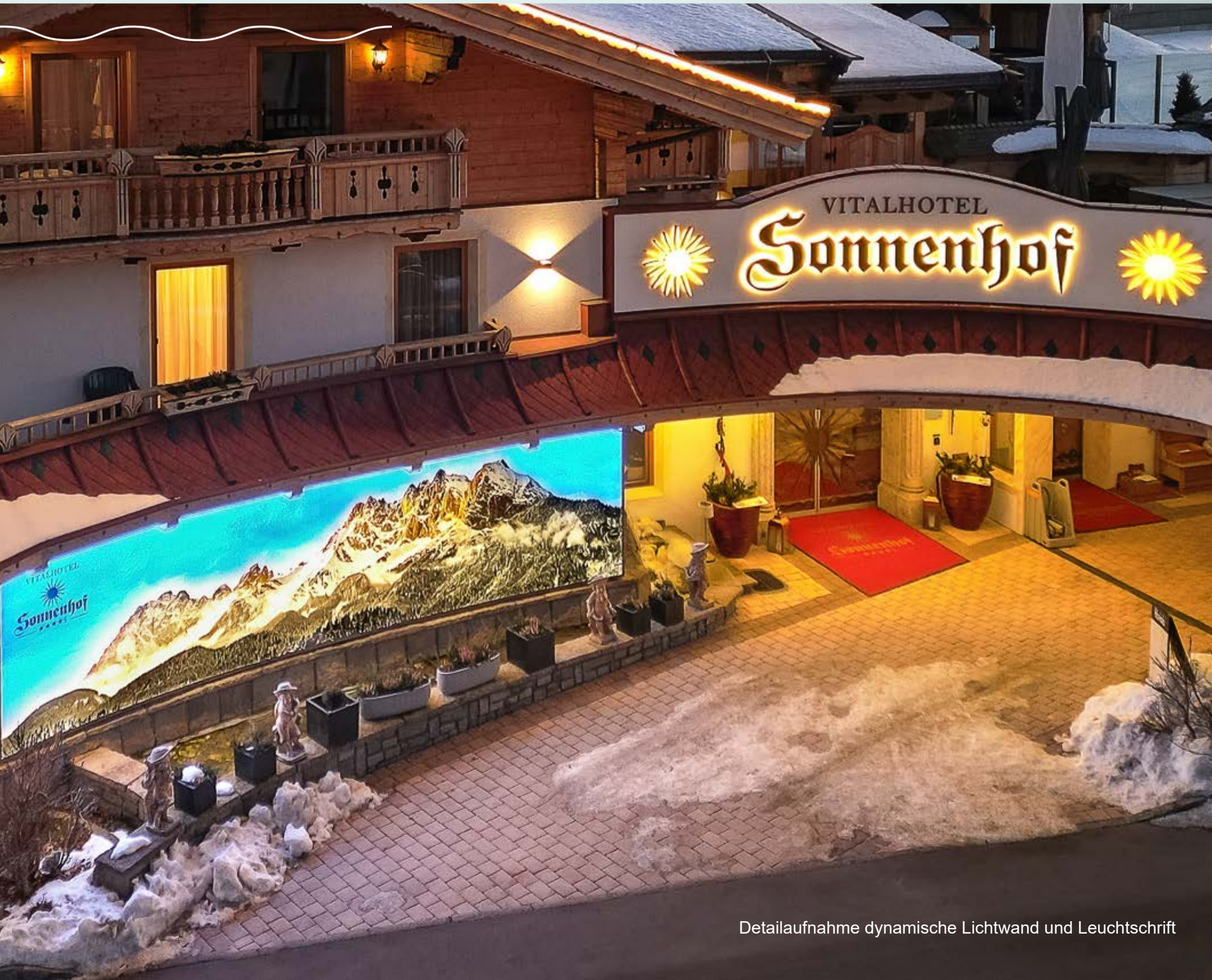
Detailaufnahme dynamische Lichtwand und Leuchtschrift