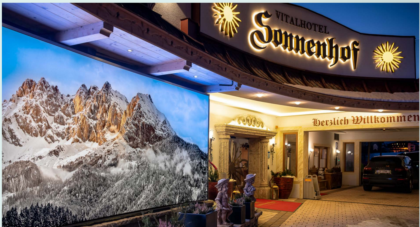
Eingangsbereich Vitalhotel Sonnenhof – dynamische Lichtwand und beleuchtete Einzelbuchstaben

Mittlerweile ist die Lichtwand zu einem beliebten Selfie-Spot unter den Gästen und zu einer Marketingstrategie für das Vitalhotel Sonnenhof geworden.