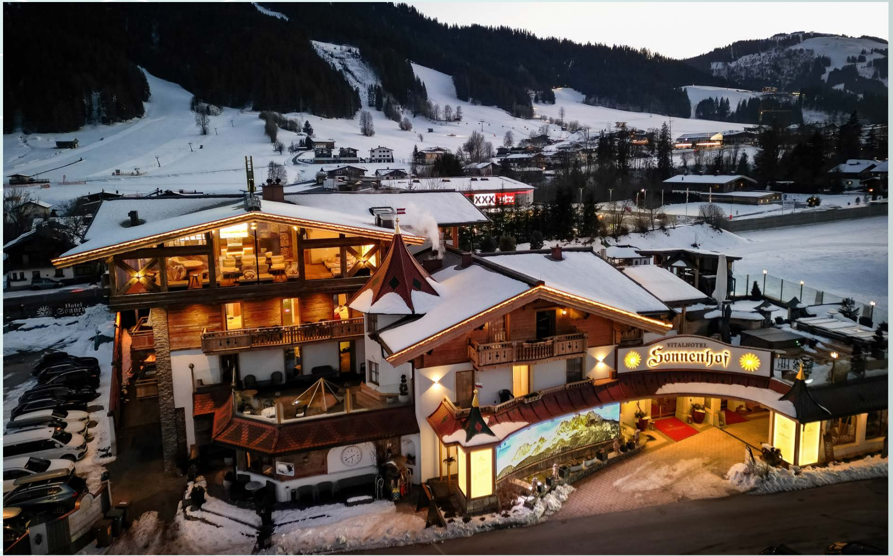
Gesamtansicht Vitalhotel Sonnenhof ****S