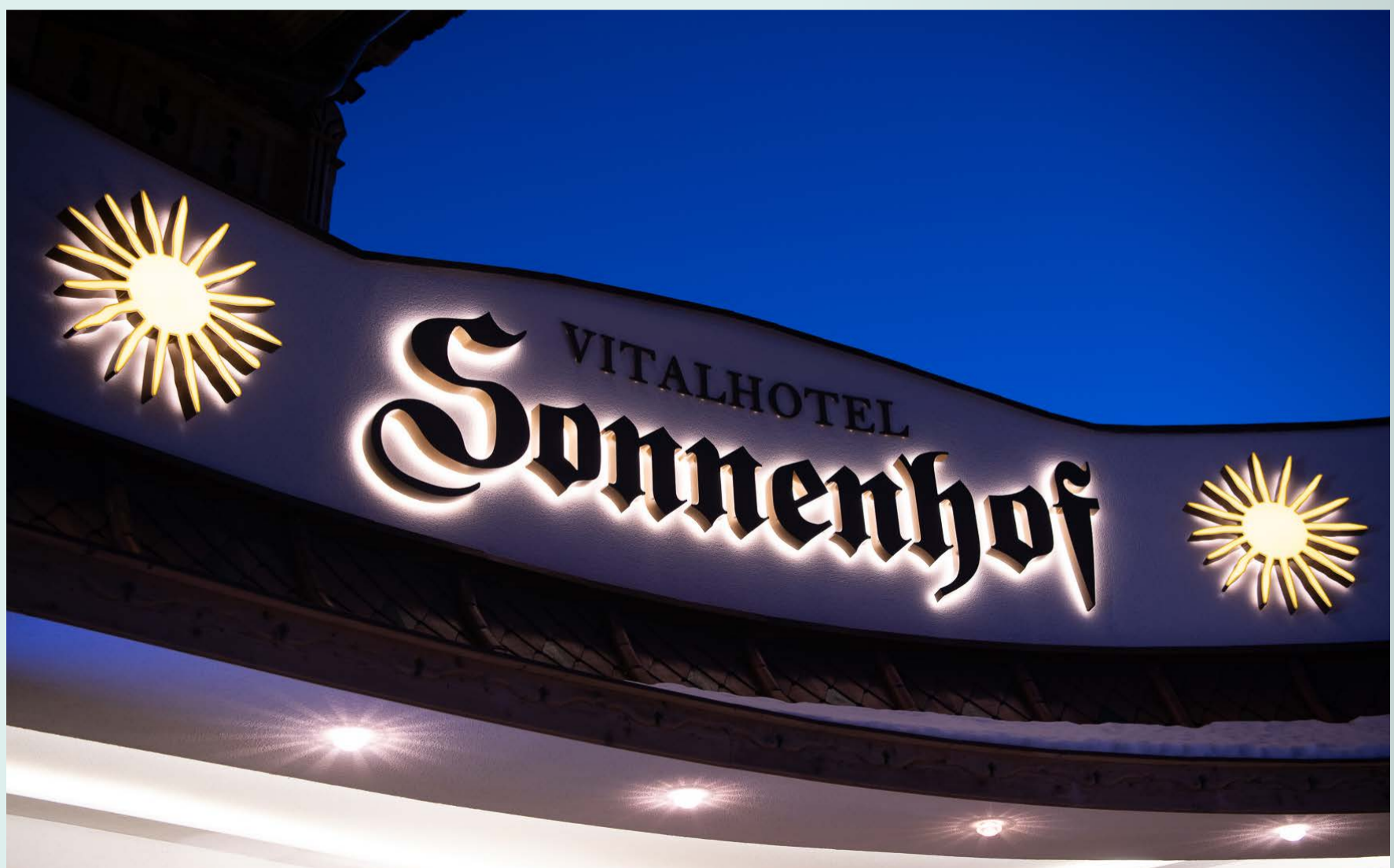
Beleuchtete und unbeleuchtete Buchstaben auf Grundplatte

Wir unterstützen unsere Kunden in allen Belangen zu ihrer neuen Lichtwerbung – daher wurde auch die für den Schriftzug benötigte Verkabelungsplatte in halbrunder Sonderform von uns angepasst und vom Fassadenbauer mit Strukturputz versehen.