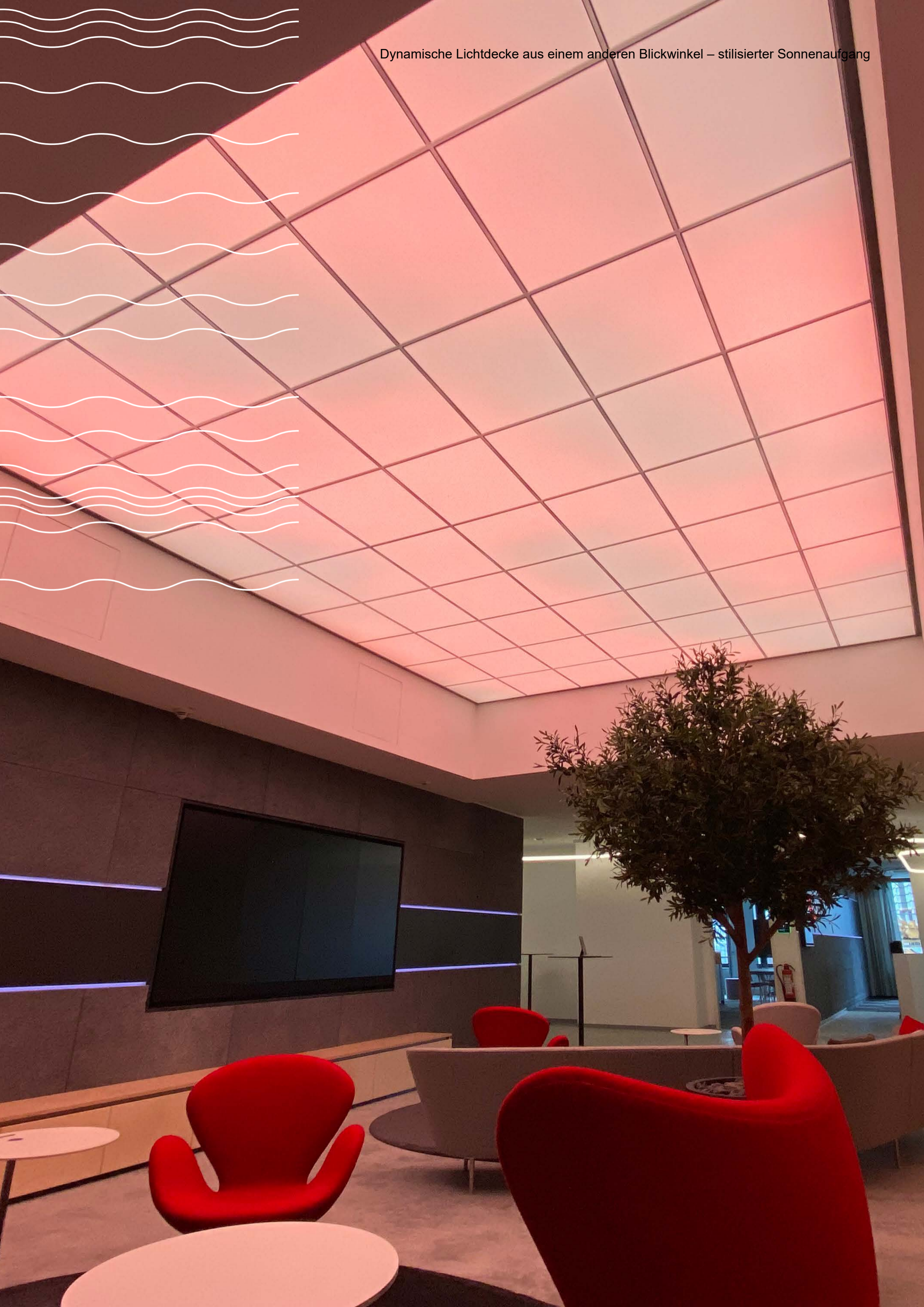
Dynamische Lichtdecke aus einem anderen Blickwinkel – stilisierter Sonnenaufgang