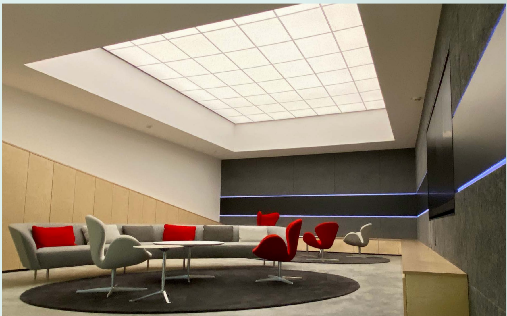
Eingangs- bzw. Wartebereich mit dynamischer Lichtdecke – weiß beleuchtet

Die Räumlichkeiten sind eine perfekte Symbiose aus Licht, Design und Innenausstattung.