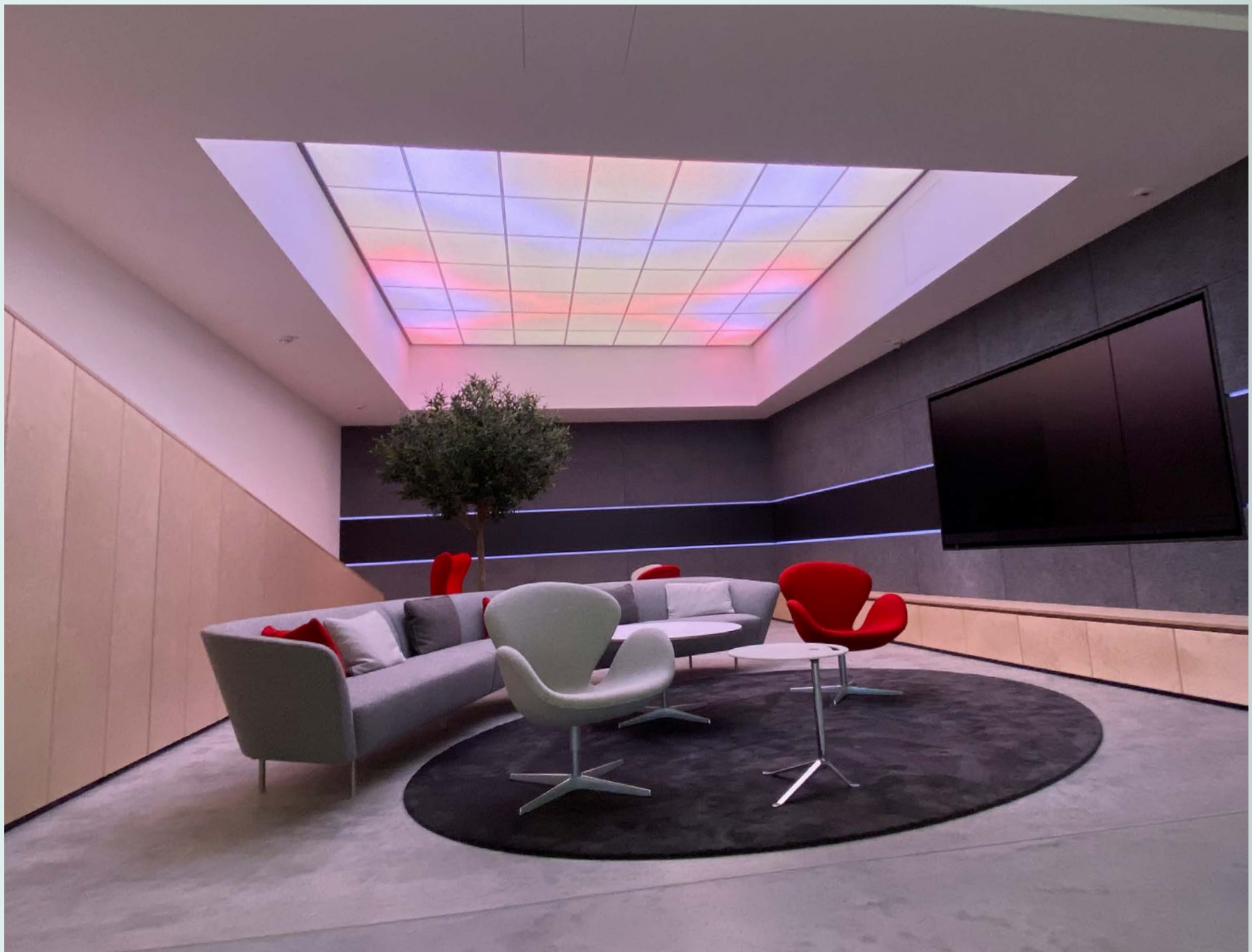
Lichtdecke mit farbiger Lichtstimmung

Die quadratisch angeordneten Linien auf dem Textilbanner sollen einzelne Glaskacheln darstellen. Somit wird die Idee eines Atriums wieder aufgenommen.